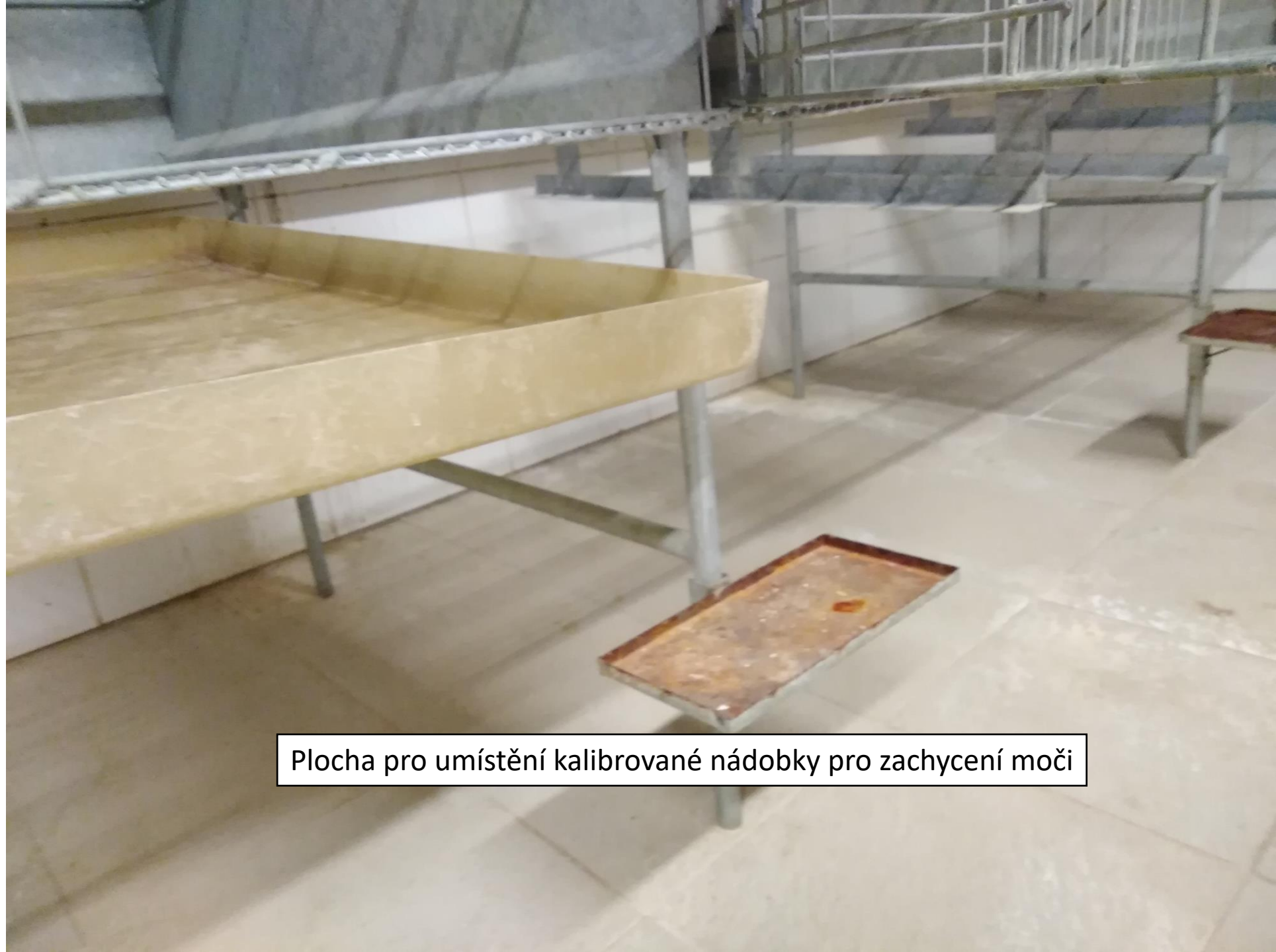
Plocha pro umístění kalibrované nádoby pro zachycení moči